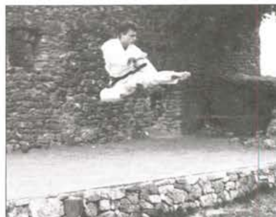
YOKO - TOBI - GERI

Une, deux, trois, quatre heures par semaine, mois et années passant, l'impétrant gagne ses ceintures blanche, jaune orange verte, bleue, violette, marron, noire, avant