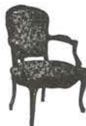
Pose de Moquettes

St CHRISTOL-LEZ-ALES - Tél. : 66.60.78.08