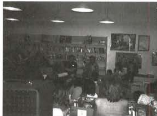
repartir avec un livre, alors qu'il y a 5 ou 6 ans, je comptais les doigts sur les doigts d'une main. Donc, par le biais des petits - on amène des enfants de plus en plus petits : ceux de la crèche ont 2 ans...), les parents deviennent lecteurs à leur tour.

Entretien avec Madame CARLE L'animatrice de la Bibliothèque Municipale