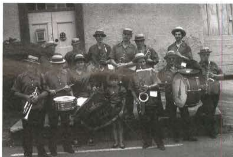
Sortie du 12 Août 1990 à l'ESTRECHURE

RENSEIGNEMENTS : Tél. 66.30.21.14 66.52.05.06 66.60.73.81