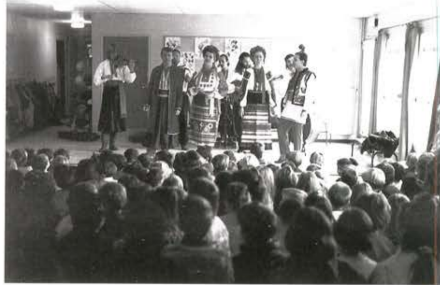
Le Groupe UKRAINA à Marignac

Récemment, nos petits amis de Grande Section, du CP et du CP-CE1 ont pu découvrir la ferme d'Anduze où ils ont passé une journée inoubliable, fruit de nombreux souvenirs et de