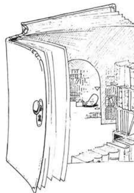
Illustration tirée d'un «Guide-Lecture» édité par le CDCA - Alès.