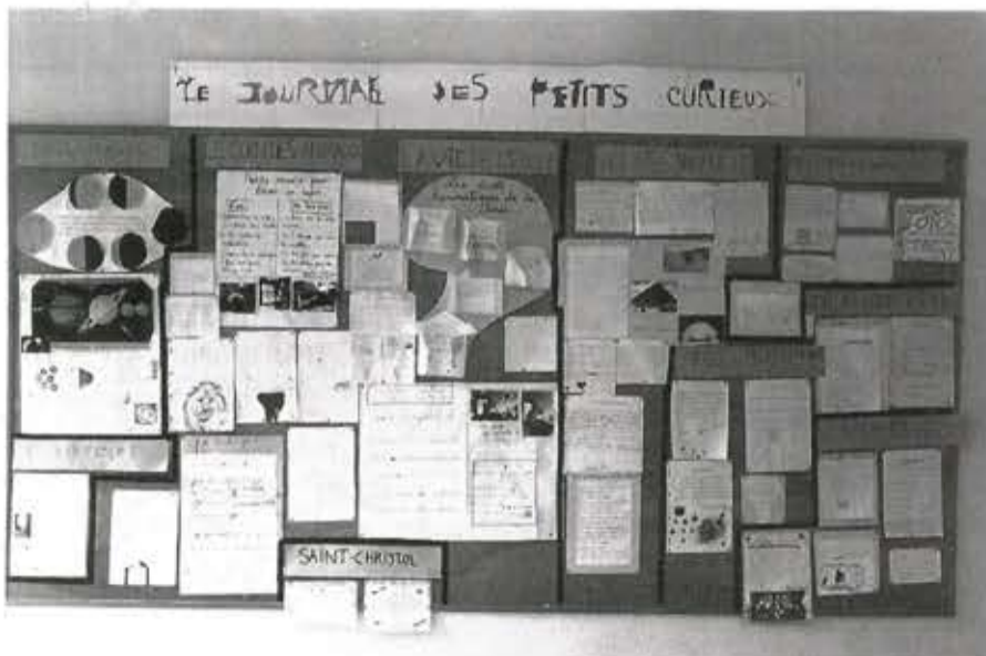
Le journal des petits curieux (Marignac)