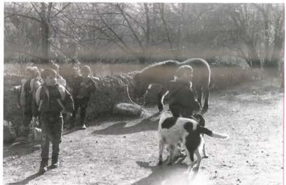
Les enfants de Montèze à la ferme d'Anduze

compte rendus à venir (dessins, textes, photos...)