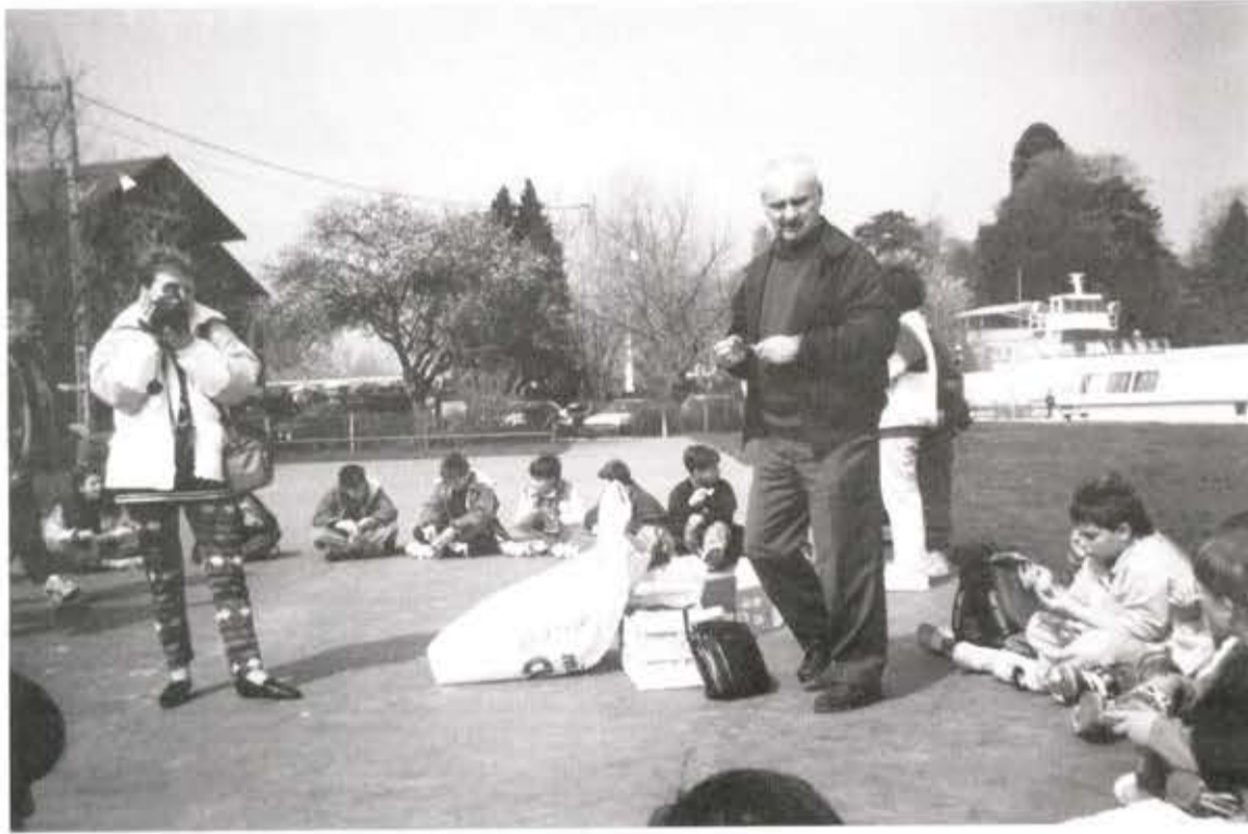
Pique-nique au lac d'ANNECY.