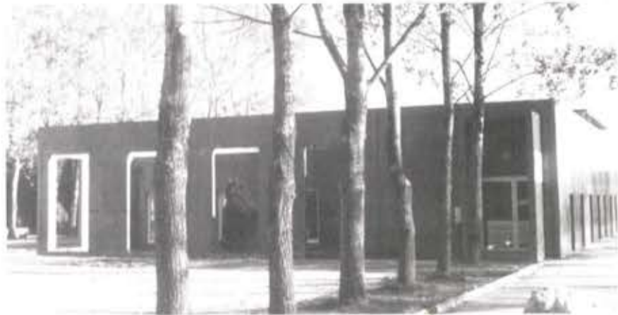
Le centre médico-social départemental avec les nouvelles ouvertures exigées par la municipalité.

Durant cette présentation l'architecte avait particulièrement insisté sur l'architecture novatrice et "aérée" des bâtiments, plans et coupes à l'appui et sur l'utilisation pour les façades... d'un nouvel enduit à base de pierres projetées !