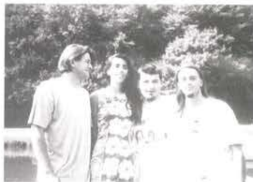
Attention... DRIVE BLIND sur scène n'a plus rien à voir avec cette charmante photo...

Pour terminer ce Festival, une dernière soirée hommage au label Angevin BLACK ET NOIR, qui a bien voulu se pencher sur le Rock Gardois puisqu'ils ont signé les DRIVE BLIND mais aussi une soirée nouveauté car les 3 Groupes sortent un nouvel album chacun. Enfin une soirée musicale entre le Seattle Sound et la Noisy Pop Anglaise car DUCK OF DA DAY, DRIVE BLIND ou les BURNING HEADS ont biberonné le hard core américain qu'ils pimentent de mélodies endiablées et venimeuses qui s'incrusteront dans votre crâne que ce soit "I don't know" des DUCKS, Peppermint Paranoïa des Drive ou "Alone" des Têtes Brûlées.