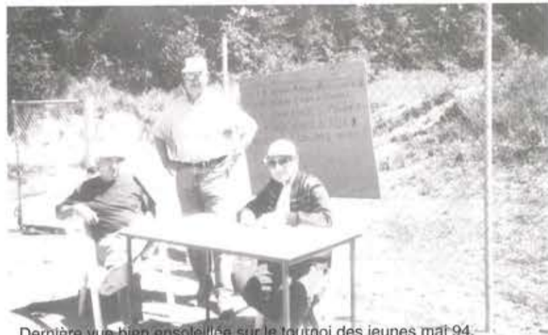
Dernière vue bien ensoleillée sur le tournoi des jeunes mai 94.

** En attendant bonne saison sportive à tous.