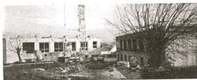
La Maison de Retraite sort de terre