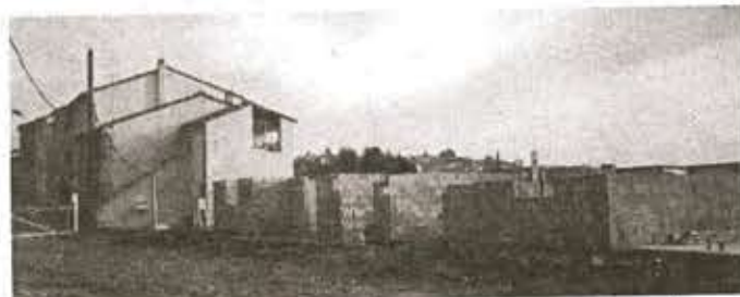
Début de la nouvelle tranche des logements sociaux de Cavalas (25 villas supplémentaires).