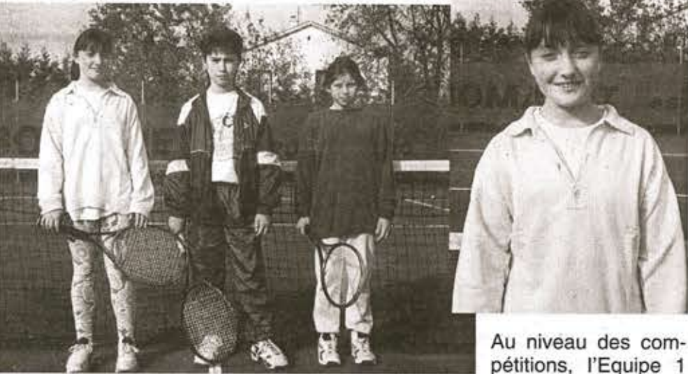
Au niveau des compétitions, l'Equipe 1 est en Promotion

Cette méthode a ses premiers résultats puisque l'équipe Benjamin Mixte a été sacrée Vice-Championne du Gard avec des jeunes du Club dont C.ROSSO, E.NICOLLE, Y.CHAMBONNET, A.LESACHE et JC MUR, C.ROSSO a même été sélectionné pour participer aux divers rassemblements jeunes du Gard.