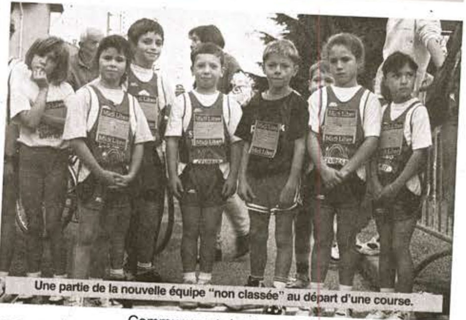
Une partie de la nouvelle équipe "non classée" au départ d'une course.

A ce jour, la municipalité est active à nos côtés; sa participation est indispensable et elle doit être notre partenaire principal et participer à la réussite du Club. La construction d'une piste sur la