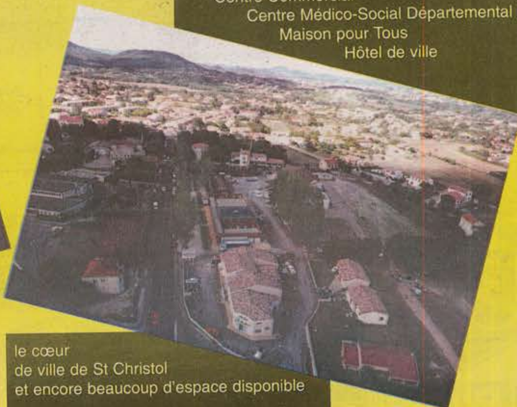
le cœur de ville de St Christol et encore beaucoup d'espace disponible