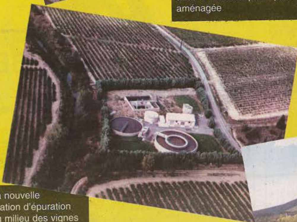
La nouvelle Station d'épuration au milieu des vignes