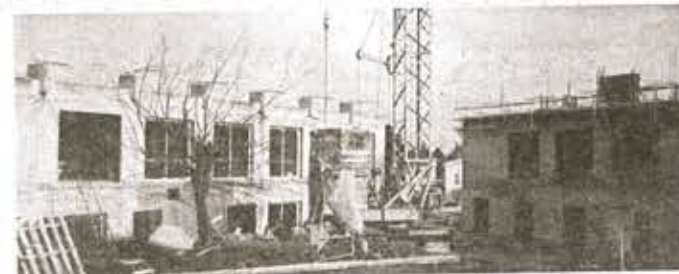
Un chantier qui suit son cours : La Maison de Retraite.