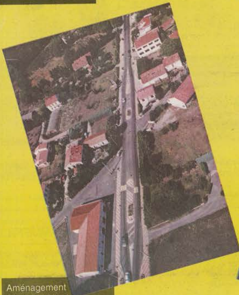
Aménagement en entrée Nord de la R.N. 110 : le but réduire la vitesse