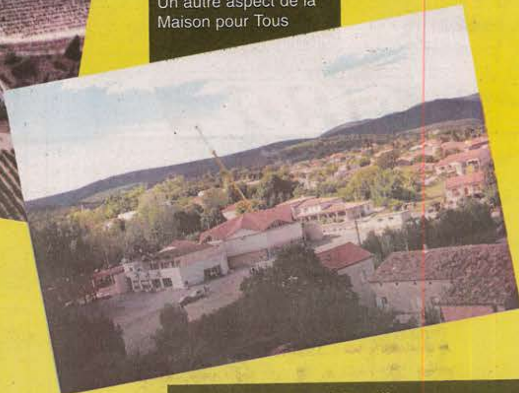
Un autre aspect de la Maison pour Tous