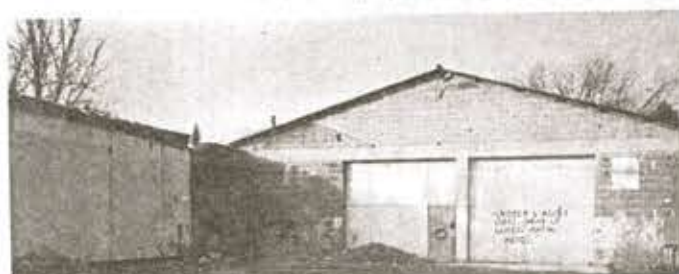
Le début du chantier de la salle de sport à partir de l'ancien garage municipal (Chantier d'insertion)