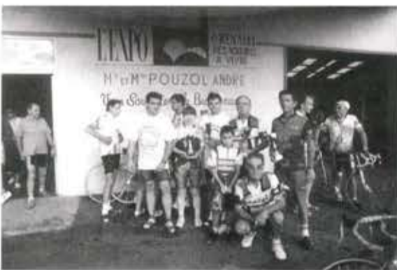
photo : le groupe des récompensés lors de la randonnée du 10/9/94.

Votre INTERMARCHÉ Saint-Christol-lez-Alès