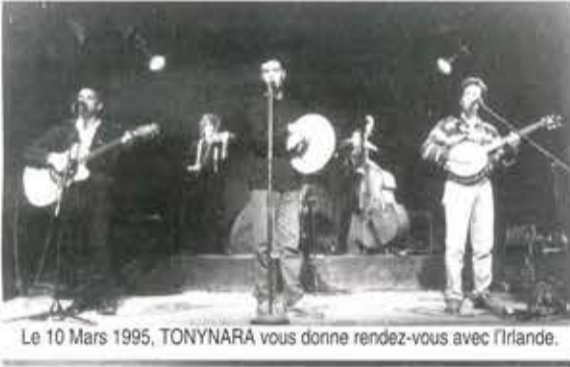
Le 10 Mars 1995, TONYNARA vous donne rendez-vous avec l'Irlande.

Et puis il est possible qu'il y ait quelques surprises !!!