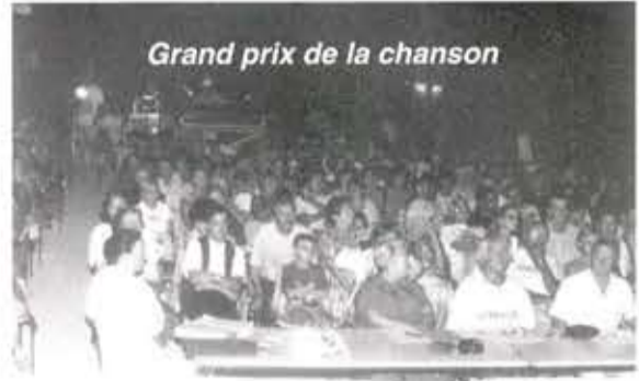
Grand prix de la chanson