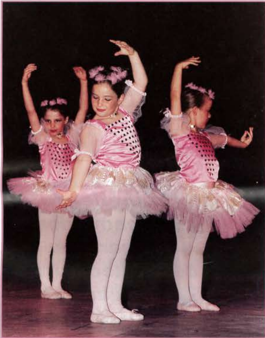
Ecole de Danse Nathalie De Marans

Les petits rats de l'école de danse vous souhaitent «Une heureuse année 1995»