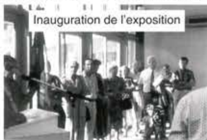
Inauguration de l'exposition