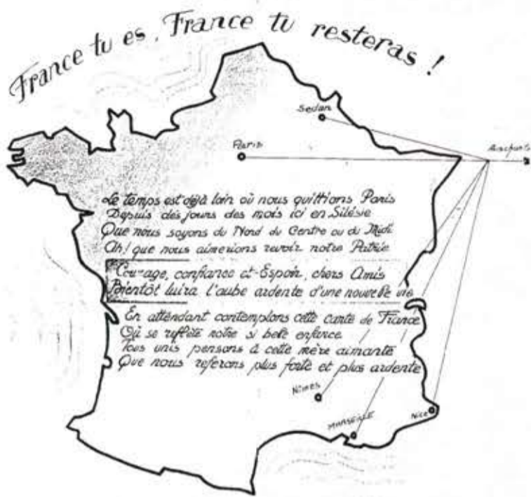
Carte coloriée de bleu, blanc, rouge, dessinée à Auschwitz par un jeune Bességeois, un copain de S.T.O.

22 H 30 arrivée en gare d'Oppeln nous croyons être arrivés. 23 h 30 distribution de casse-croûte en sortant de la gare. 23 h 40 départ à pied pour le camp. 23 h 55 arrivée aux baraques nous posons nos valises.