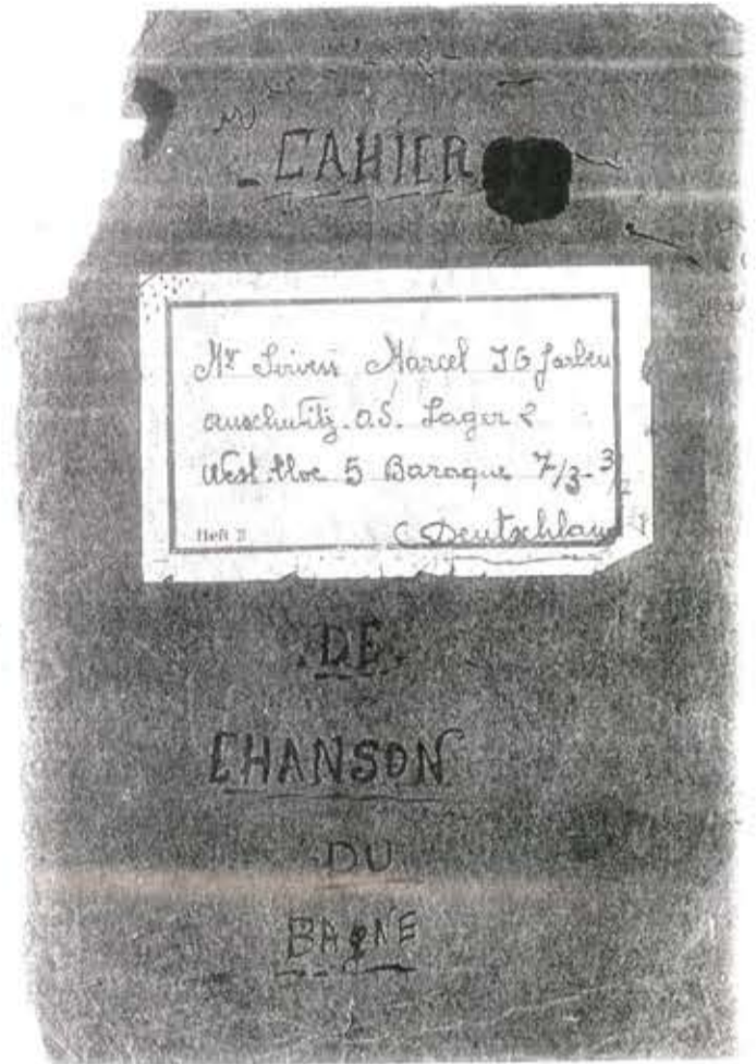
Fac simile de la couverture du journal de l'époque de Marcel Sirven.

- 15 mars 43 : 4 h 25 arrive à Glauchau. 5 h 50 nous passons à Heheinstein Ernstthal. 6 h 15 arrivée à Schenitz 1er débarbouillage. 7 h 05 départ de la gare de Schenitz. 8 h 15 passons à Freiberg (Sachs). 8 h 30 arrêt à 1 kilomètre de la gare de Freibrichz nous descendons du train pour discuter avec des prisonniers. 12 h départ de Dresden : ville industrielle très importante, nous passons sur un grand fleuve. 13 h passons à Andorf (Sachs).