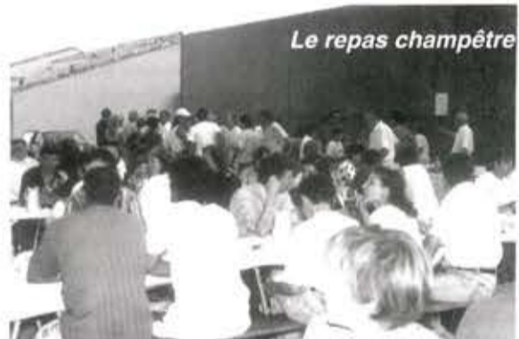
Le repas champêtre

Ceci dit la fête 94 restera un grand cru tant au niveau du choix des orchestres que des diverses animations dont la plus prisée fût sans conteste le «Grand Prix de la Chanson» dont le plateau de choix fût offert par le Comité des Fêtes