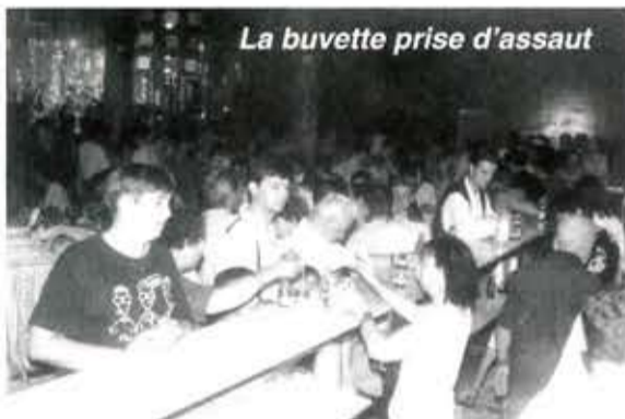
La buvette prise d'assaut