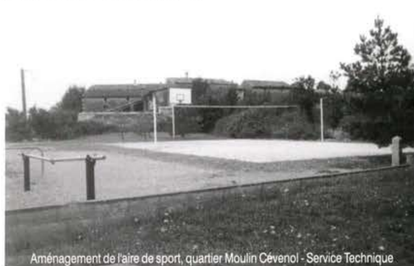
Aménagement de l'aire de sport, quartier Moulin Cévenol - Service Technique