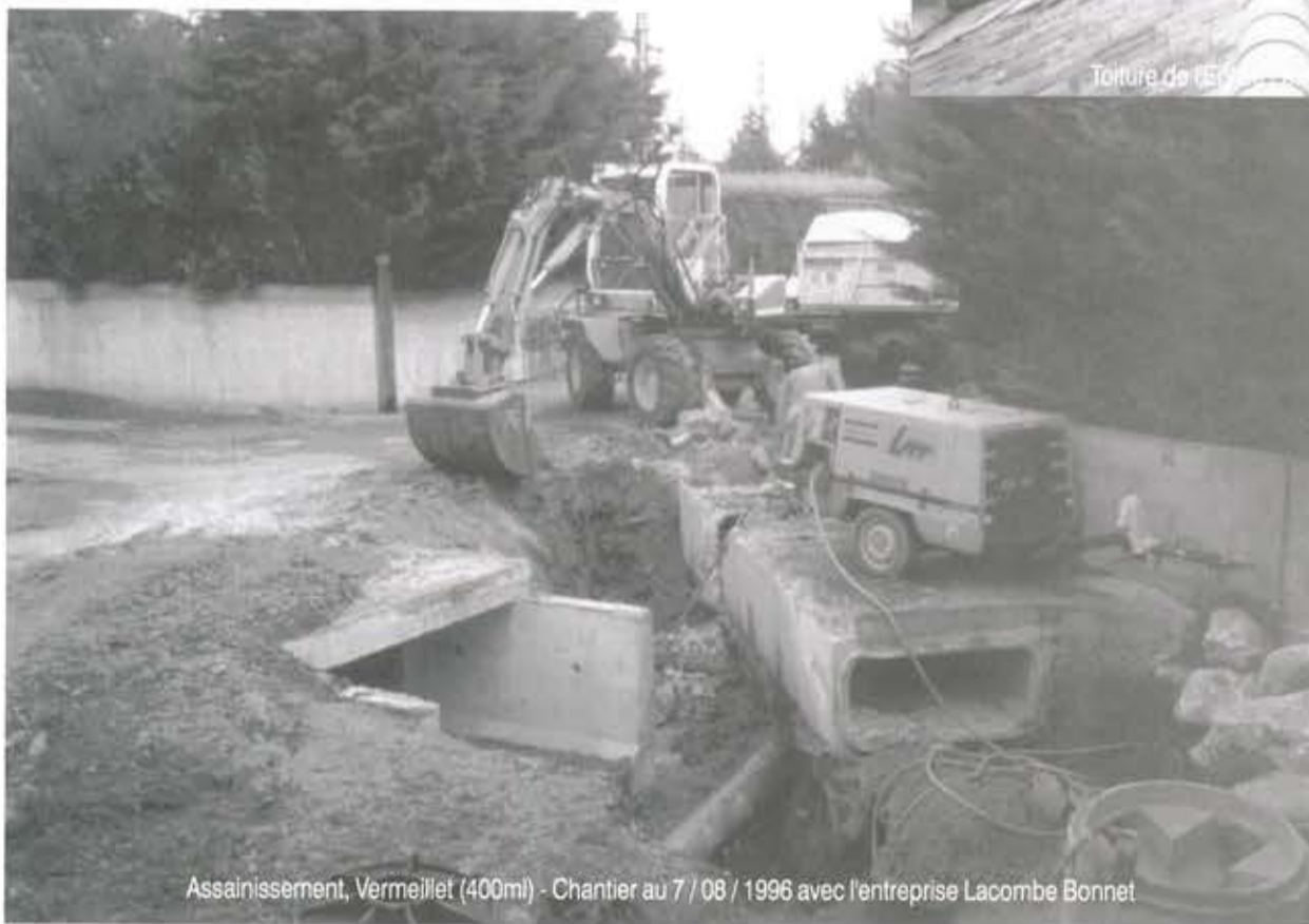
Assainissement, Vermeillet (400ml) - Chantier au 7 / 08 / 1996 avec l'entreprise Lacombe Bonnet