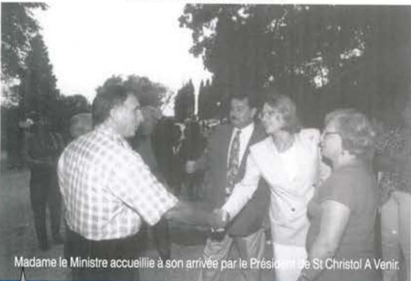
Madame le Ministre accueillie à son arrivée par le Président de St Christol A Venir.