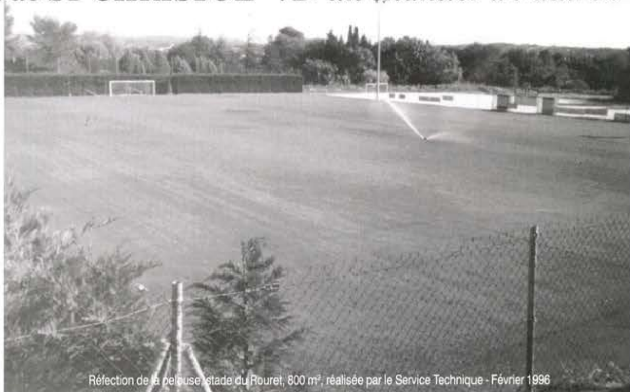
Réfection de la pelouse stade du Rouret, 800 m 2 , réalisée par le Service Technique - Février 1996

- Entrée Nord (Service ALES) : ENFIN !!! La mairie a reçu la confirmation de la DDE que celle-ci devrait intervenir très prochainement sur la partie de chaussée détériorée.