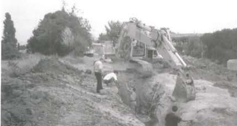
Assainissement Vermeillet - 400 ml - Entreprise Lacombe Bonnet et Cabinet Gaxieux