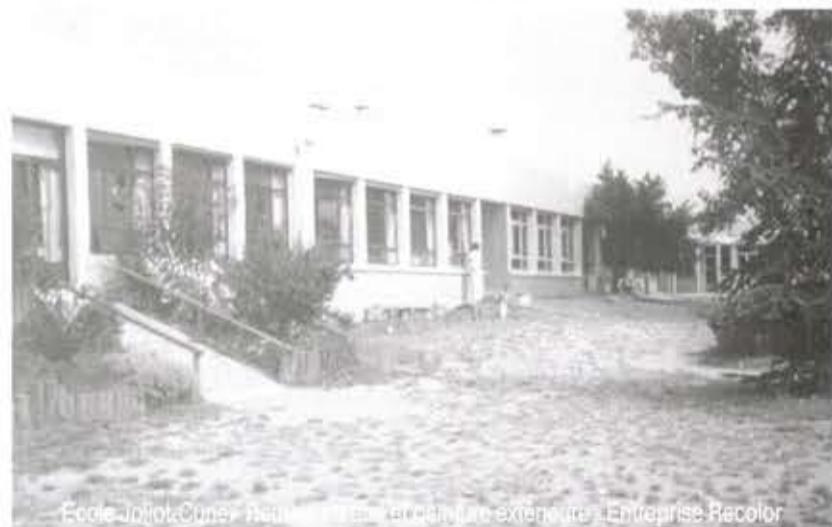
École Joliot-Curie - Réfection des façades extérieures - Entreprises Recolor

- Interventions sur les peintures extérieures (Panneau basket, grilles, rampes, portail...) suite à la réfection totale des façades de l'école.