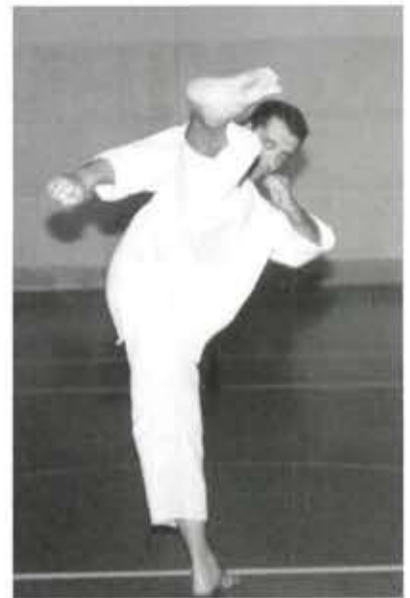
Février 97 : championnat Inter région à Sète (Hérault)

Compétition : F.F.S.T. KARATE. Janvier 97 : championnat Gard Région Alès (Gard)