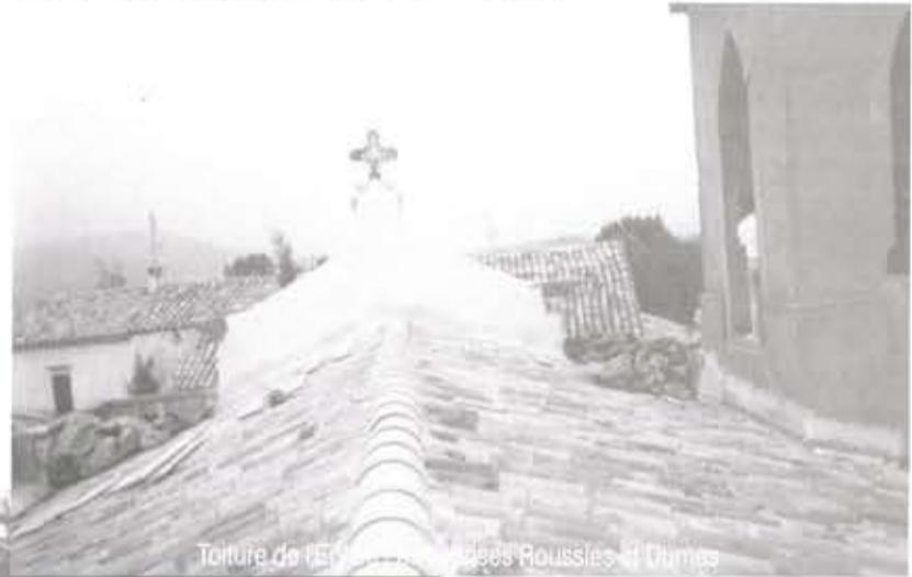
Toiture de l'église de St-Christol-les-Alès

emplacement. Presque deux mois de travail intense pour redonner à cette école un autre aspect. Mais quel résultat ! J'espère qu'élèves et enseignants seront satisfaits. Quelques finitions seront apportées durant le prochain trimestre de façon à terminer complètement cette réalisation.