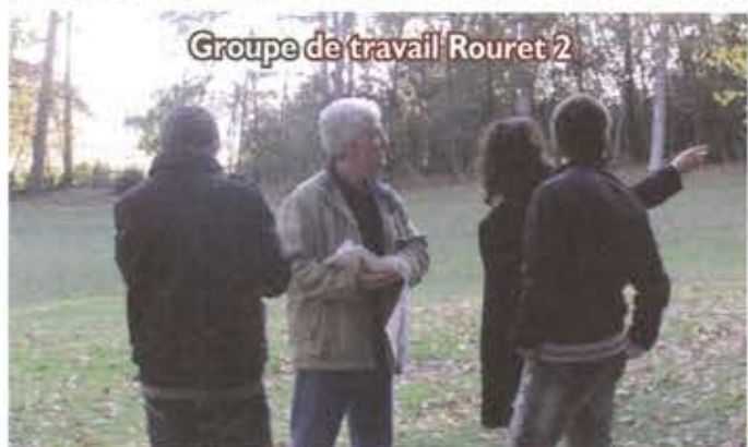
Groupe de travail Rouret 2