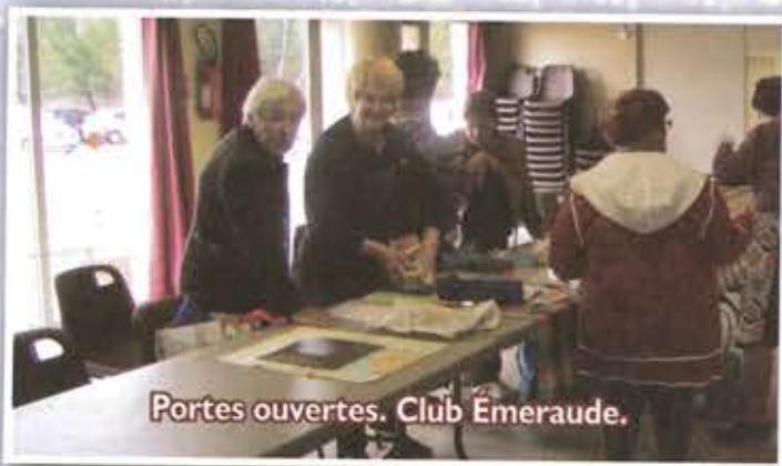
Portes ouvertes. Club Émeraude.