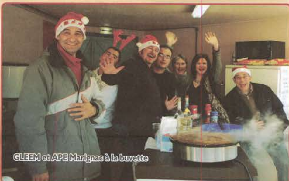
GLEEM et APE Marignac à la buvette