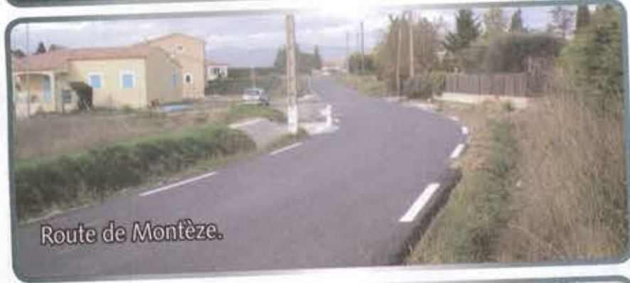
Route de Montèze.