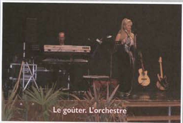
Le goûter. L'orchestre