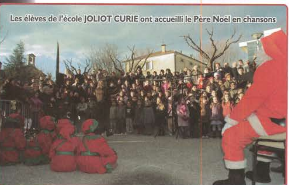
Les élèves de l'école JOLIOT CURIE ont accueilli le Père Noël en chansons