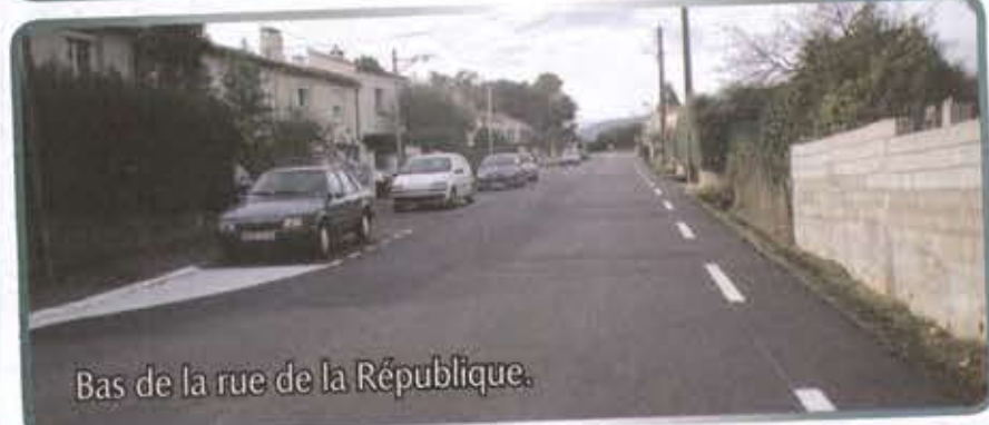
Bas de la rue de la République.