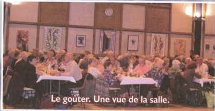
Le goûter. Une vue de la salle.