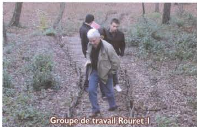
Groupe de travail Rouret 1