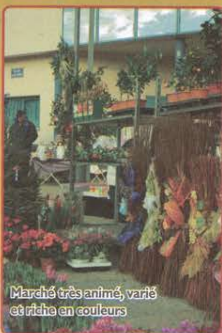
Marché très animé, varié et riche en couleurs

Cette journée de fête s'est terminée au son des mélodies alpines interprétées par l'orchestre LA KINKERNE, autour