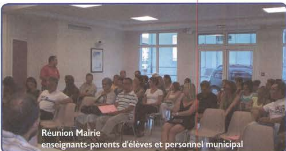
Réunion Mairie enseignants-parents d'élèves et personnel municipal