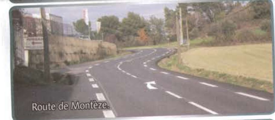
Route de Montèze.