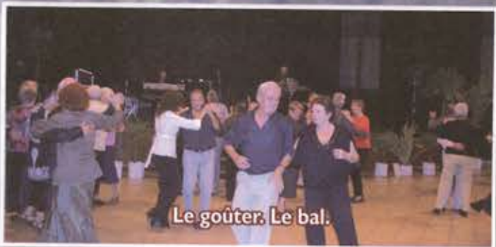
Le goûter. Le bal.

Tous les acteurs qui ont contribué à la réalisation de la "Semaine Bleue" se sont retrouvés pour analyser les différentes activités proposées. Nos remerciements à tous ceux qui, dans un bel élan, ont permis que cette "première" voit le jour.