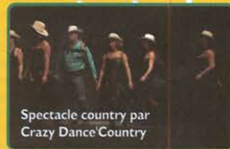
Spectacle country par Crazy Dance'Country