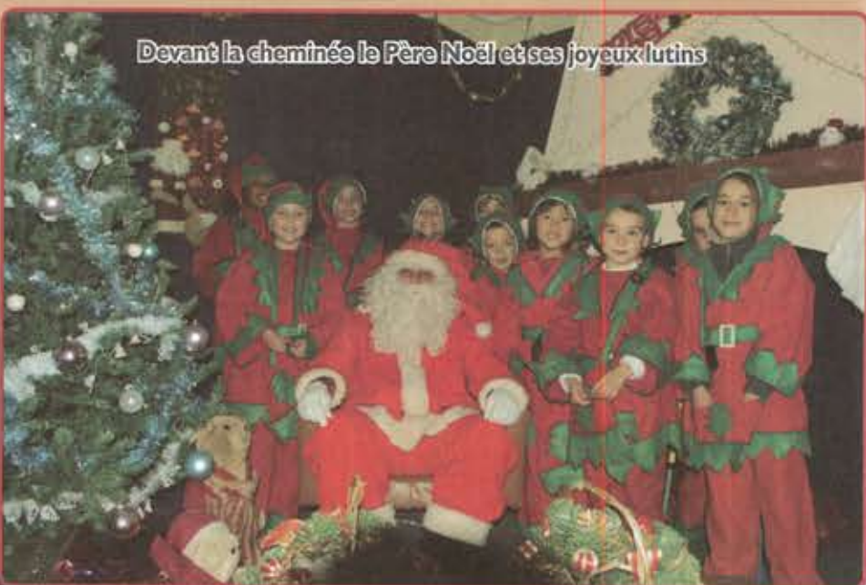
Devant la cheminée le Père Noël et ses joyeux lutins