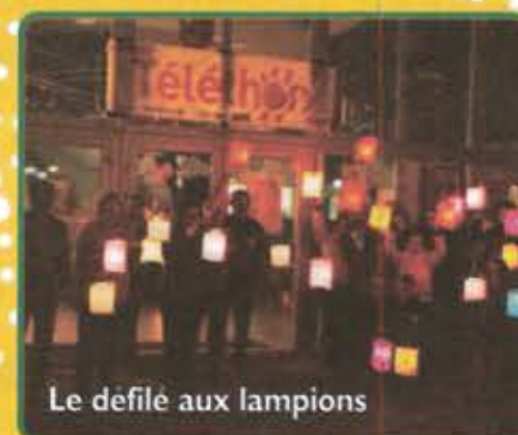
Le défilé aux lampions