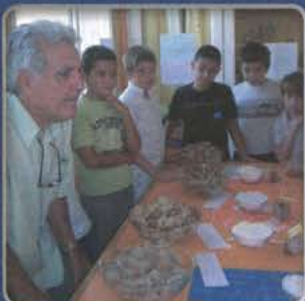
Table de découverte pain bio