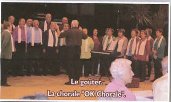
Le goûter. La chorale "OK Chorale".