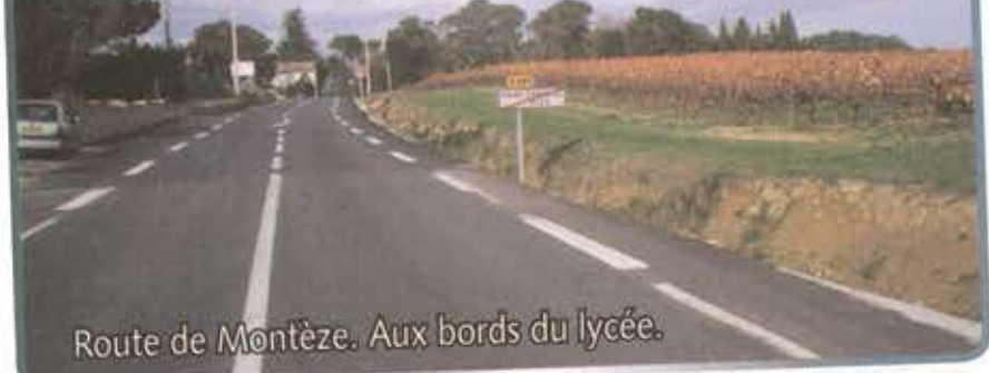
Route de Montèze. Aux bords du lycée.