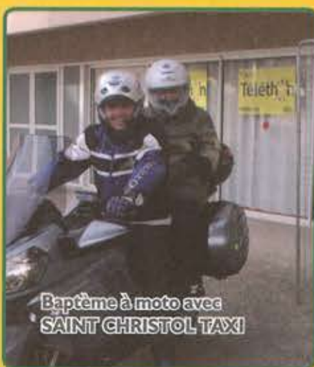
Baptême à moto avec SAINT CHRISTOL TAXI