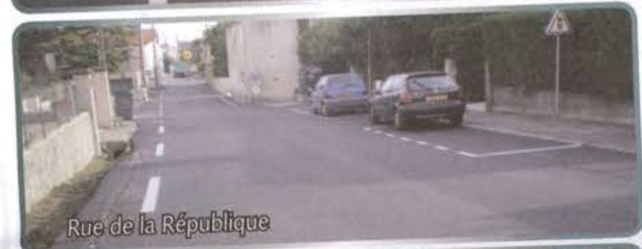
Rue de la République