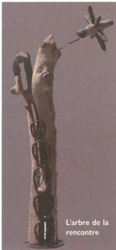
L'arbre de la rencontre

Le dimanche 11 octobre, dans un registre plus léger, la Compagnie Tous en Scène nous permettait de retrouver les célèbres Vamps dans un voyage à Lourdes acerbé et désopilant, devant plus de 200 personnes. Évidemment ce n'étaient pas les « vraies » Vamps, qui ne tournent plus pour l'instant, mais des acteurs locaux de cette troupe anduzienne, dont certains ont travaillé par le passé avec Jean-Noël Schwingrouber. La mise en scène était signée