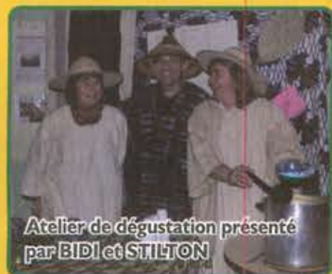
Atelier de dégustation présenté par BIDI et STILTON