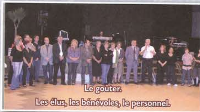
Le goûter. Les élus, les bénévoles, le personnel.