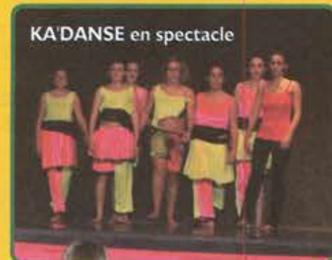
KA'DANSE en spectacle