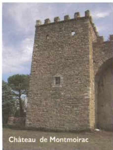
Château de Montmoirac

Ce dernier trimestre 2009 fut plutôt riche en offres culturelles variées et, je pense, de qualité.