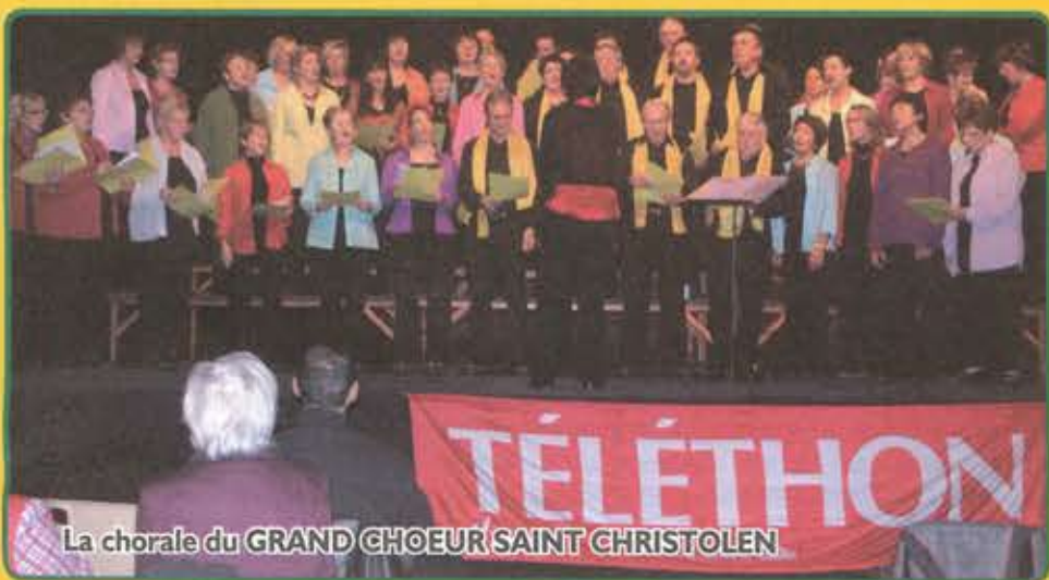
La chorale du GRAND CHOEUR SAINT CHRISTOLEN