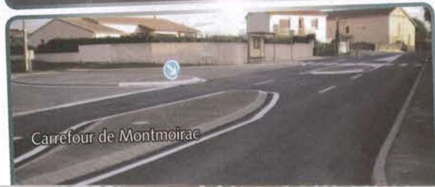
Carrefour de Montmoirac