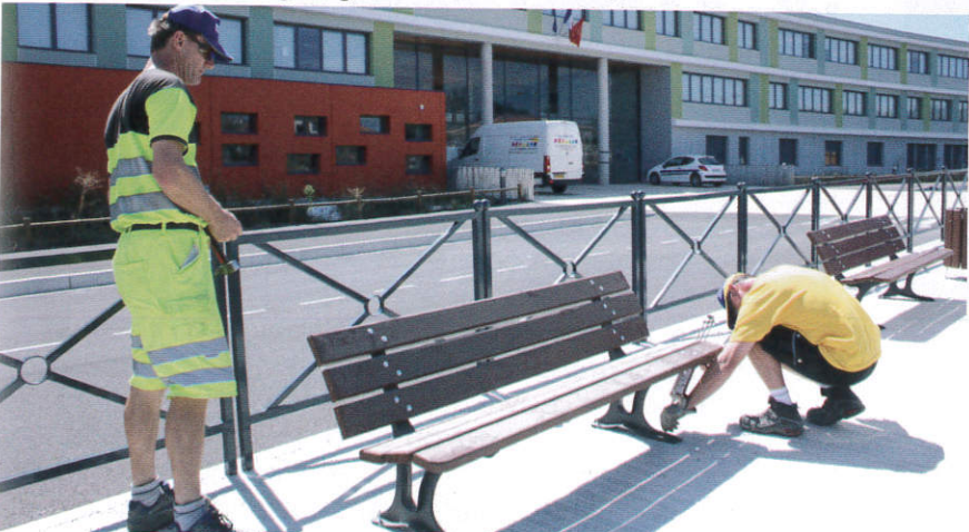
Les agents municipaux installant des bancs au lycée Prévert