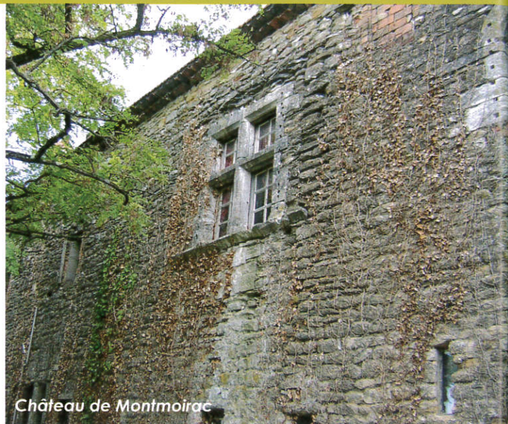
Château de Montmoirac

Comme l'année dernière, les habitants de Saint Christol et d'ailleurs ont pu découvrir ou redécouvrir l'extérieur des 3 châteaux de notre commune, grâce à une visite guidée organisée dans le cadre des Journées nationales du Patrimoine, les 18 et 19 septembre derniers. Cette initiative, proposée pour la première fois par la municipalité en 2009, rencontre toujours un franc succès et est appelée à durer. Entièrement gratuite, elle ne pourrait pas se faire sans l'aide de nombreux bénévoles passionnés et la gentillesse des propriétaires des châteaux.