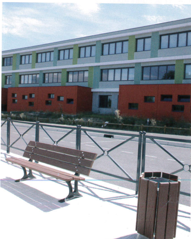
14 bancs et 4 corbeilles ont été posés par la municipalité