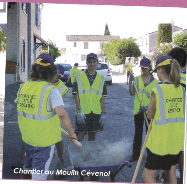
Chantier au Moulin Cévenol