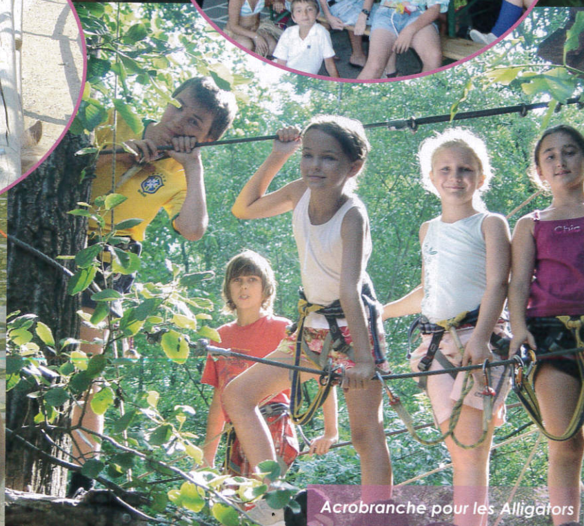
Acrobranche pour les Alligators