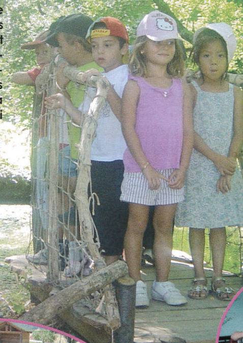
Ci-contre : au parc «Parfum d'aventures» pour les hippos. Ci-dessous : Veillée costumée chez les Alligators et les Castors