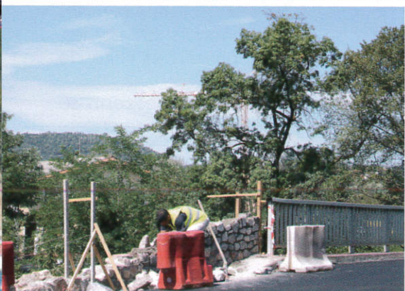
Elargissement du trottoir et construction d'un muret en pierres sur le pont de l'Alzon