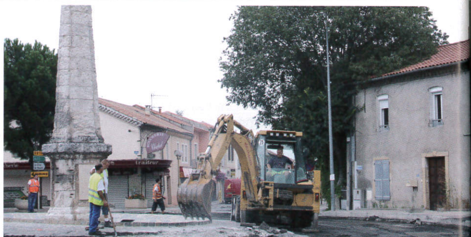
A gauche et ci-dessus : Réfection de la chaussée sur la RD 6110 par le conseil Général