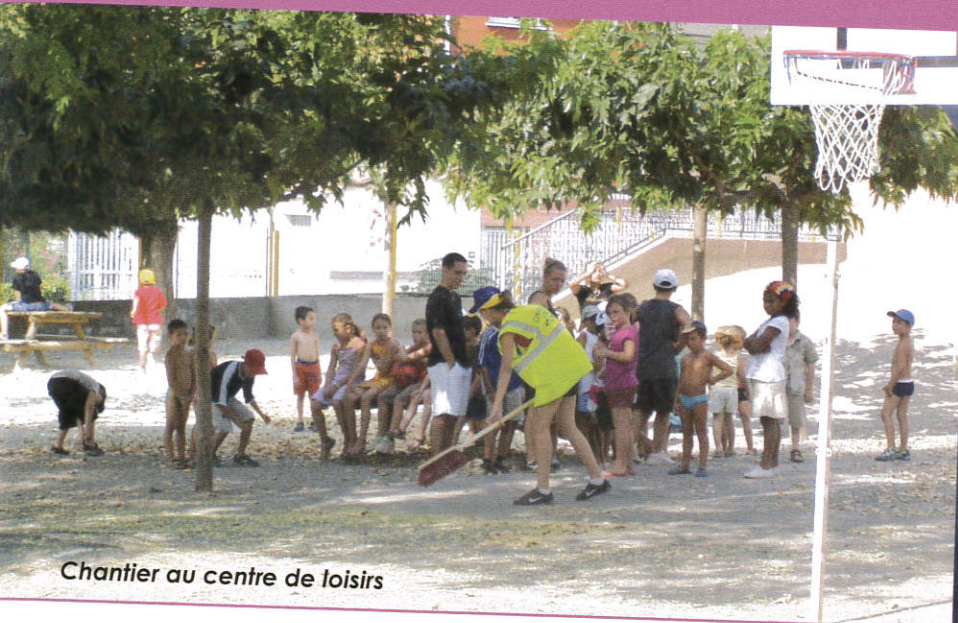
Chantier au centre de loisirs