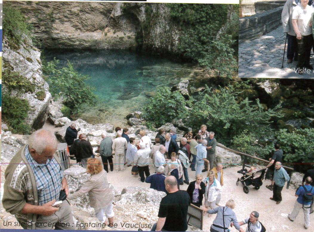
Un site d'exception : Fontaine de Vaucluse