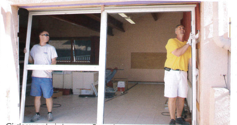
Ci-dessus et ci-dessous : Remplacement des fenêtres et porte-fenêtres à l'école maternelle de Maignac