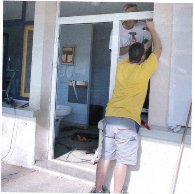
Ci-dessus et ci-dessous : Remplacement des fenêtres et porte-fenêtres à l'école maternelle de Joliot Curie