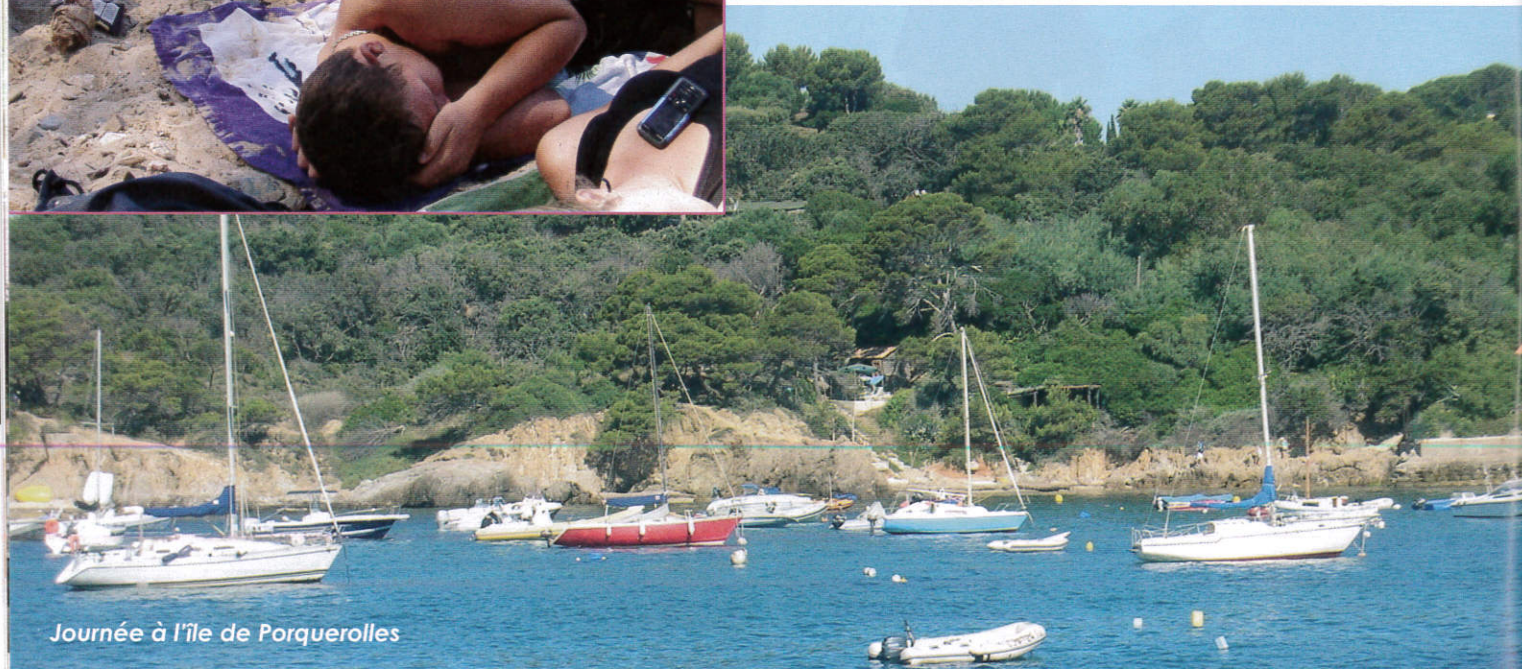
Journée à l'île de Porquerolles