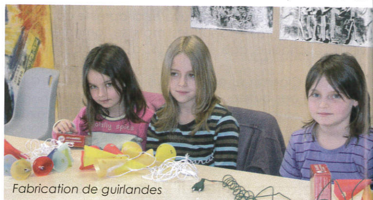
Fabrication de guirlandes

Les élèves scolarisés sur les trois écoles primaires de