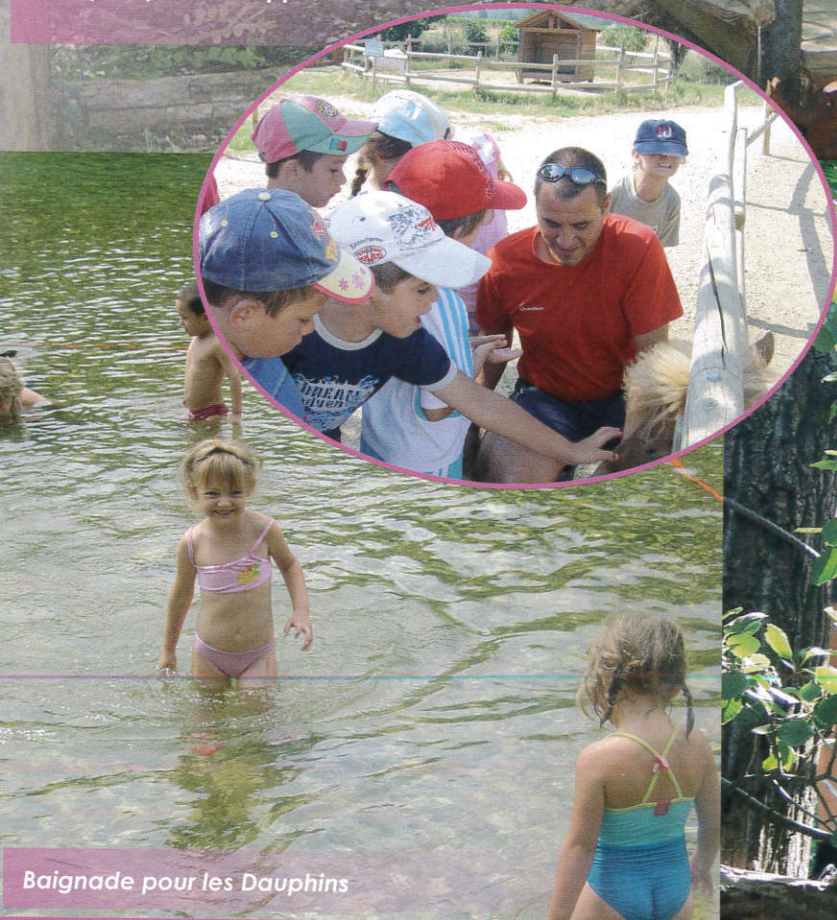
Baignade pour les Dauphins