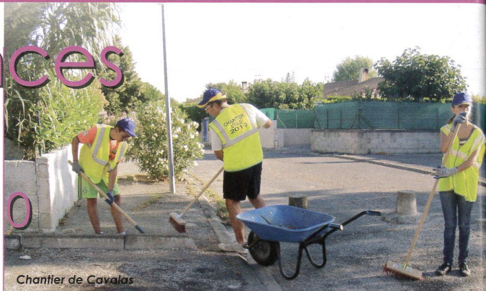
Chantier de Cavalas