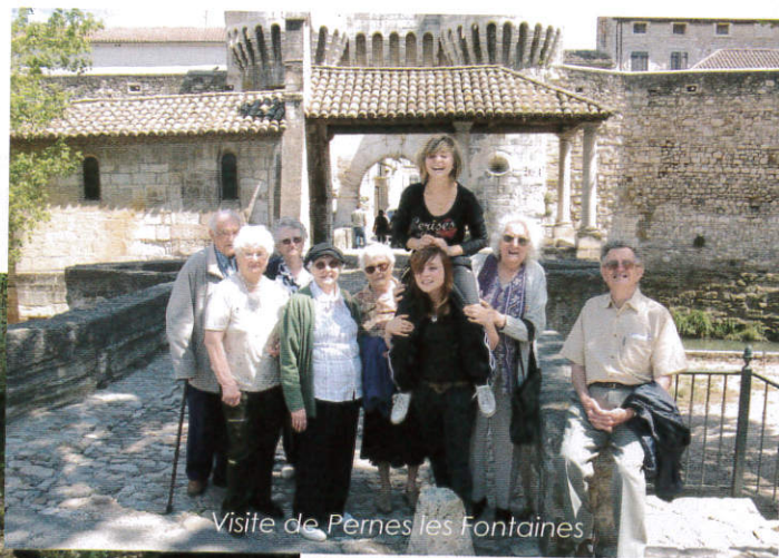
Visite de Pernes les Fontaines.