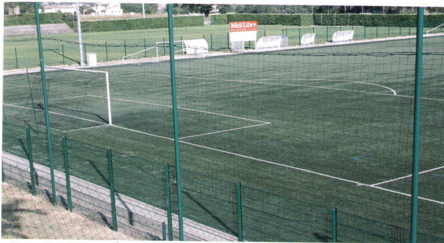
Remplacement du grillage au stade du Rouret