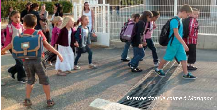
Rentrée dans le calme à Marignac