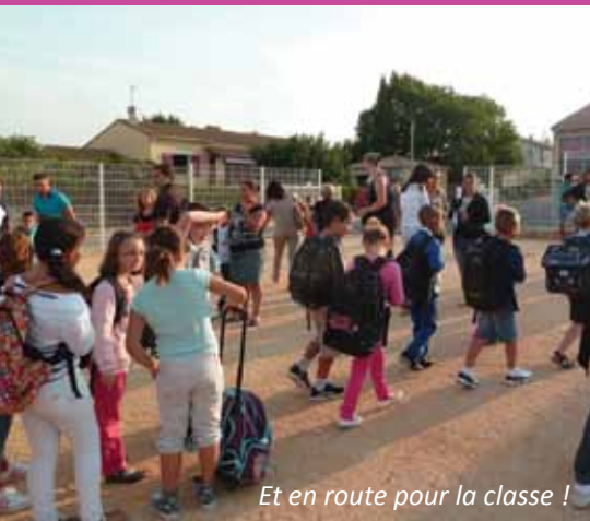
Et en route pour la classe !