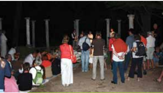
Beau temps, spectacles enchanteurs, déambulations à travers le Parc du Rouret à la lueur des torches... La « Nuit Douce » l'a vraiment été !