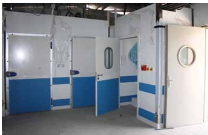
La cuisine de Marignac très avancée