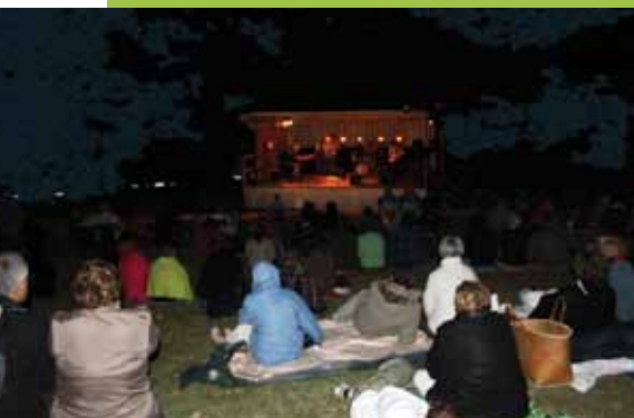
Enfin, la Nuit du Jazz a ravi les adeptes du genre, venus nombreux malgré le mistral.