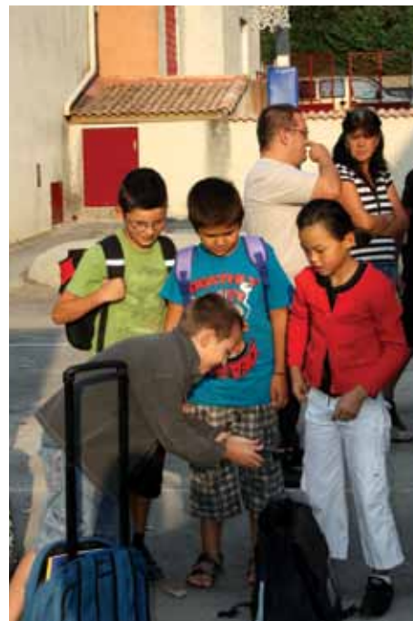
On se retrouve et on se montre les fournitures neuves