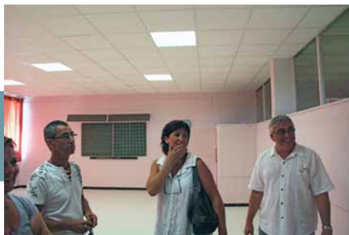
Inspection des travaux réalisés dans les écoles