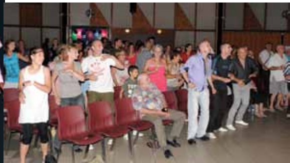
Un concert épatant de la New Gospel Family le 20 juillet a fait vibrer le public présent.