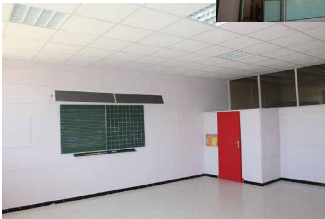
salle de classe élémentaire refaite