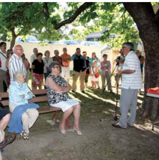
les nouveaux habitants accueilli par la municipalité, à la maison Sorbières

aux lettres des habitants concernés par chaque réunion. Nous espérons que vous viendrez nombreux, partager toutes les questions relatives à la vie de nos quartiers et discuter autour du verre de l'amitié. Les Élus essaieront de répondre à toutes vos questions, vos réflexions, vos demandes.