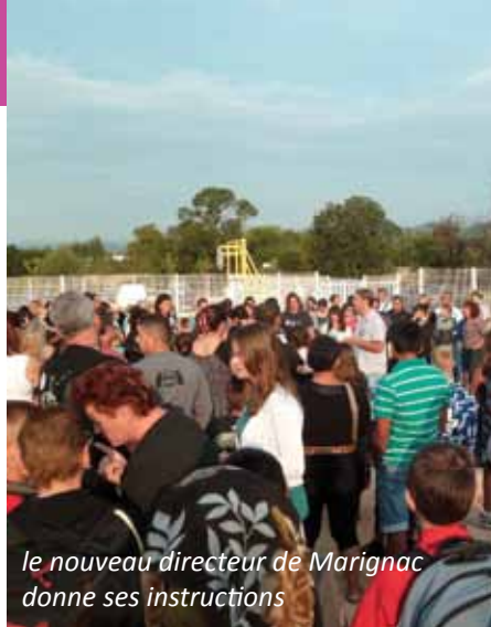
le nouveau directeur de Marignac donne ses instructions