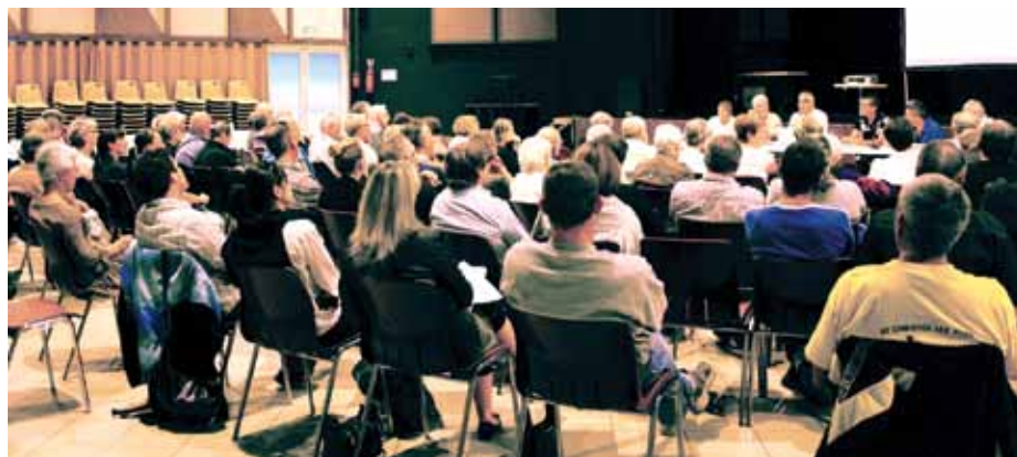
beaucoup de sujets évoqués lors des réunions de quartiers en 2011

Comme en 2011, 5 réunions de quartiers sont prévues en automne. Le calendrier arrêté donne : les 5, 12, 19 et 26 octobre et le 9 novembre. C'est à la Maison Pour Tous qu'auront lieu ces rassemblements toujours les vendredis à 18h30. Les invitations individuelles seront déposées dans les boîtes