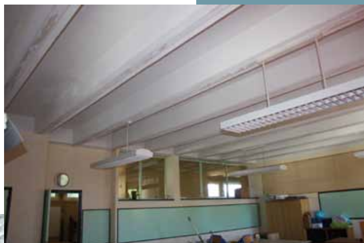
salle de classe élémentaire avant