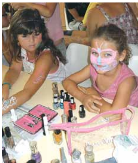
séance maquillage de fête

Cet été était bien rempli, la bonne humeur était au rendez-vous... Bref, des souvenirs plein la tête ! Le pôle Vie Sociale et Solidarité remercie les enfants, l'équipe d'animation, sans oublier le service de la restauration scolaire pour ses bons petits plats. Une nouvelle saison a commencé en septembre. L'équipe accueille les enfants au centre le mercredi et les petites vacances. Toujours dans le but de rendre l'enfant acteur de ses loisirs, la boîte à idées reprend du service, avec un nouveau thème chaque mois.