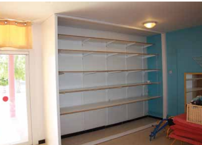
création d'espaces de stockage en maternelle