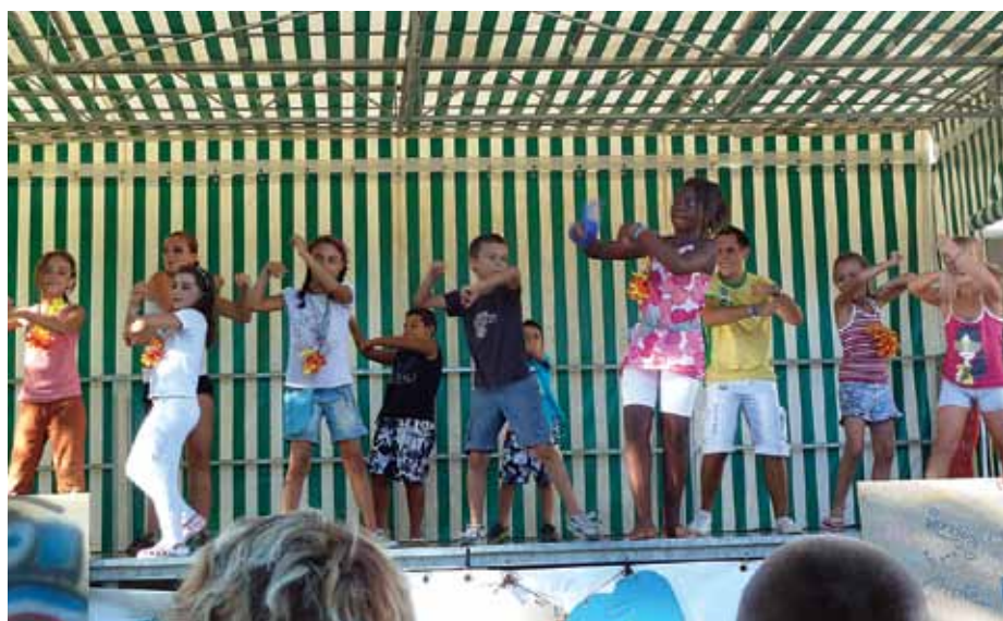
spectacle de clôture...

Cet été, le centre de loisirs a connu beaucoup d'aventures. Les petits et les grands ont fait leur « tour du monde en 26 jours », avec un programme diversifié. Les enfants avaient le choix entre des activités physiques et manuelles organisées par l'équipe d'animation. Pour voyager, les plus petits ont fabriqué un train enchanté, des fleurs, des moulins miniatures... Ils ont pu jouer en extérieur et faire bien d'autres activités. Les plus grands ont participé à des activités manuelles comme le graph', la fabrication de moulins à vent, de grands jeux tels que le Cluedo, les olympiades, des jeux d'eau et enfin à des activités culinaires. Quant aux sorties, le programme a conduit les enfants à découvrir le musée du bonbon, à visiter la grotte de la Cocalière, la Ferme Enchantée, la Bouscarasse, le Grand Bleu à la Grande Motte, à grimper dans les arbres, à nager dans les eaux de la rivière, etc. L'équipe a également organisé des nuitées très appréciées par les enfants. Après cette période intense en activités, la fête de clôture proposait aux parents un spectacle suivi d'une collation.