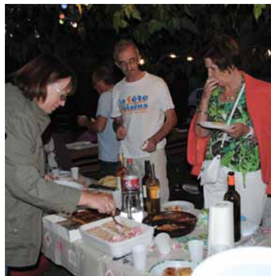
la fête des voisins a été conviviale