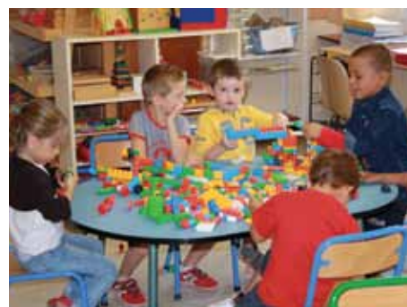
Une classe de plus ouvrira en maternelle à Joliot