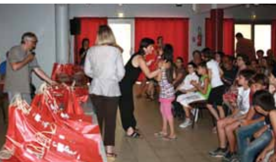
Réception des CM2 avant leur entrée au collège