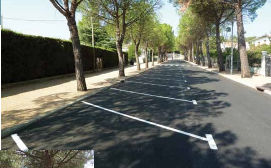
chaussée de l'avenue du Château aujourd'hui