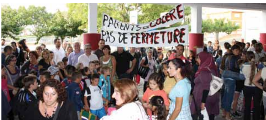
Unis pour le maintien de la classe de Joliot