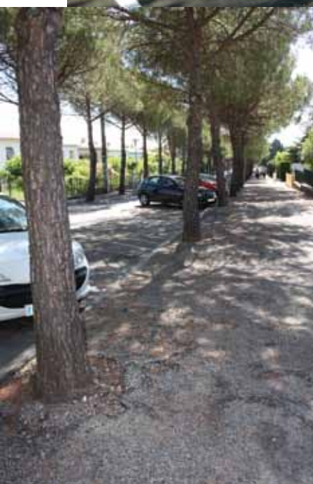
avenue du Château avant travaux